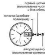
второй щелчок (выставление времени)