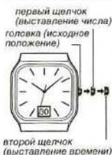
второй щелчок (выставление времени)